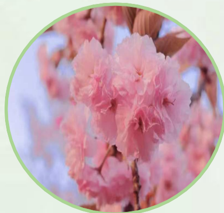
21 新闻马勇 《春天》

直到废寝忘食酣畅淋漓的一气读完,眼前的黄沙霎时消失了,颜色艳丽充满异域风的建筑陡然崩塌,我才晃过神来,原来一切都是故事,原来我还在亚洲,我离着那边神秘的大陆还是那么的遥远,撒哈拉还是那片黄沙漫天的大漠。我像是从桃花源划出的渔夫,惊闯进世外仙境,再回神时已是人间仙境,我的远方。