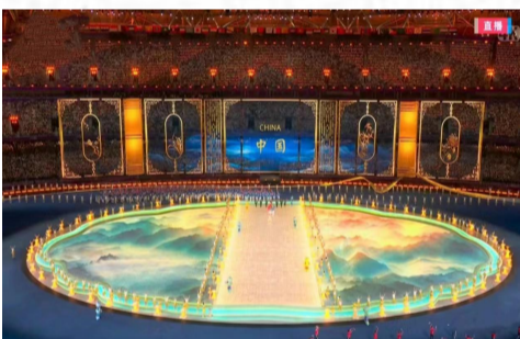
梅兰竹菊四君子,清华其中,淡泊其外,本自具足。

开幕式上安排了文人雅集的场景,从书法、绘画、点茶、焚香、篆刻、对弈、舞剑、吟诗等多个方面,彰显“风雅处处是平常”的江南生活的美学。