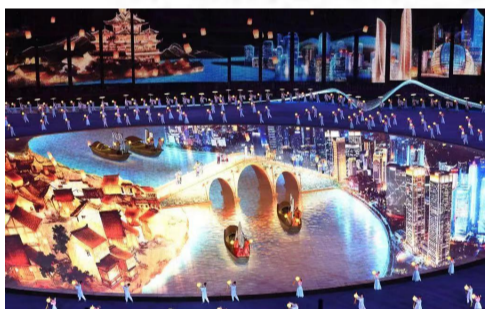
相知无远近,万里尚为邻。

秋分也是秋天的中点,是丰收在望的季节。杭州亚运会开幕正是秋分这天,以秋分开幕,也是希望运动员们在赛会上“丰收”。