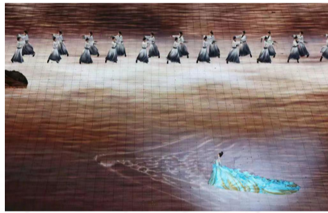
千里江山织霓裳,惊鸿一瞥,叹盛世永固。

《国风雅韵》中舞者的衣裙缀满了古建筑,随着舞步移动,画卷上泛起水波纹,中式美学惊艳全场。莲叶舒展于西湖之上,既有接天莲叶无穷碧的秀美又渲染出烟雨江南山色空蒙雨亦奇的意境唯美又浪漫。